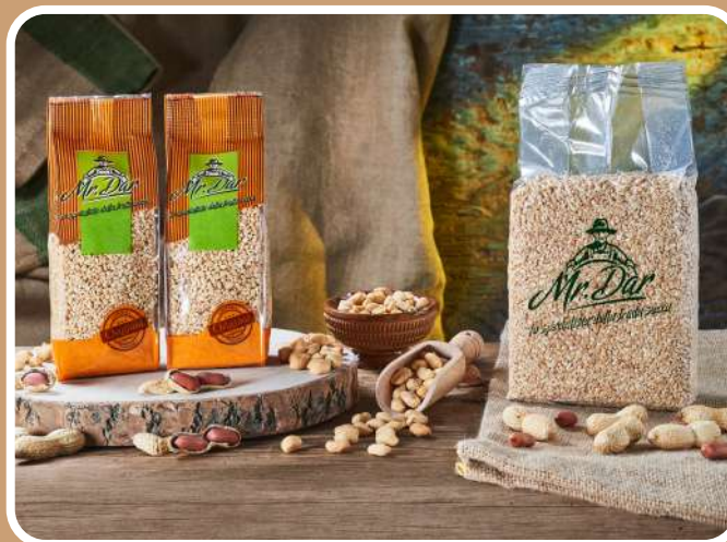
GRANELLA DI ARACHIDI TOSTATE