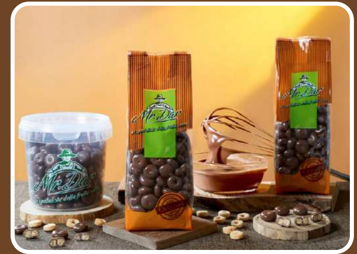
CIOCCOLATO AL LATTE