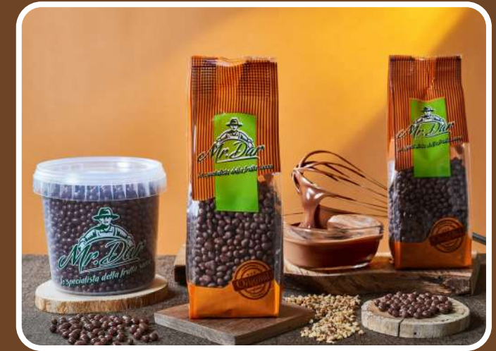
CIOCCOLATO AL LATTE