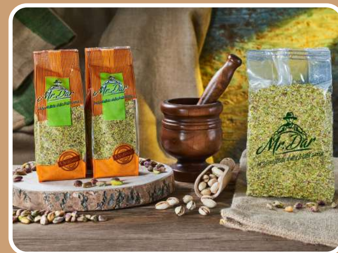
FARINA DI PISTACCHI