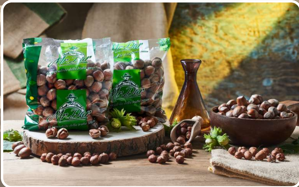
IN GUSCIO LUCIDATE