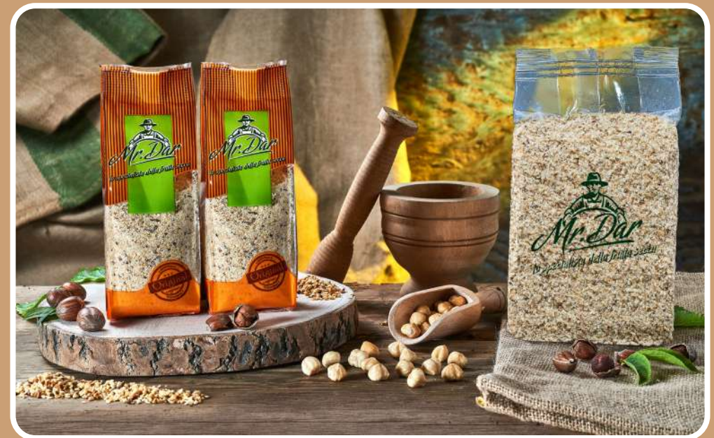
FARINA DI NOCCIOLE TOSTATE