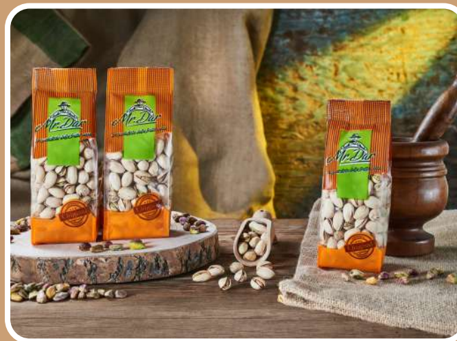
IN GUSCIO TOSTATI E SALATI

I pistacchi hanno un'origine antichissima. Le prime apparizioni della pianta di pistacchio risalgono al 20-30 d.C. Furono gli Arabi nell'800 a iniziare la coltivazione in Sicilia, alle pendici dell'Etna.