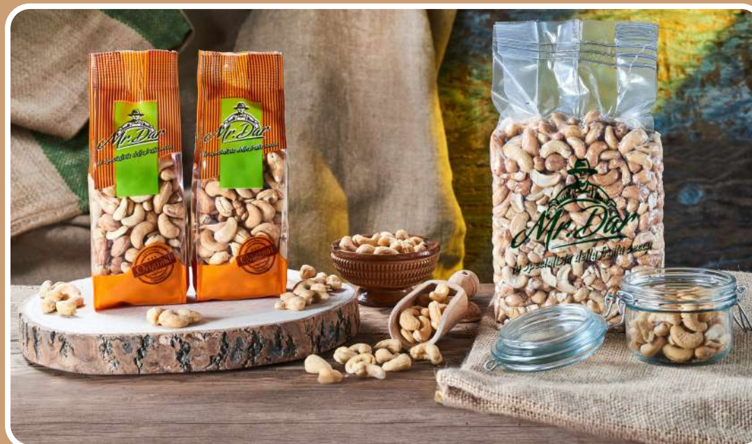
ANACARDI TOSTATI E SALATI