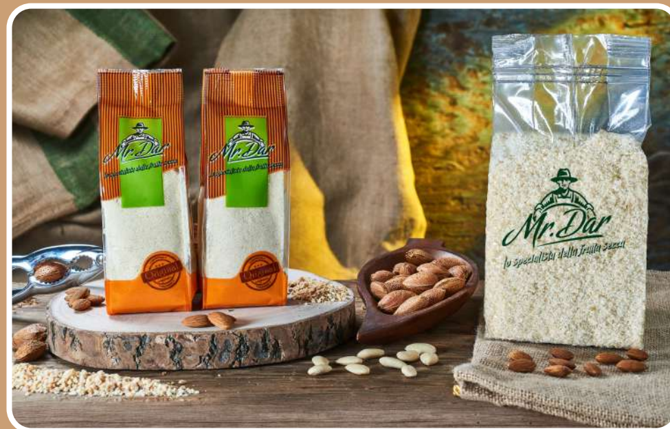
FARINA DI MANDORLE PELATE