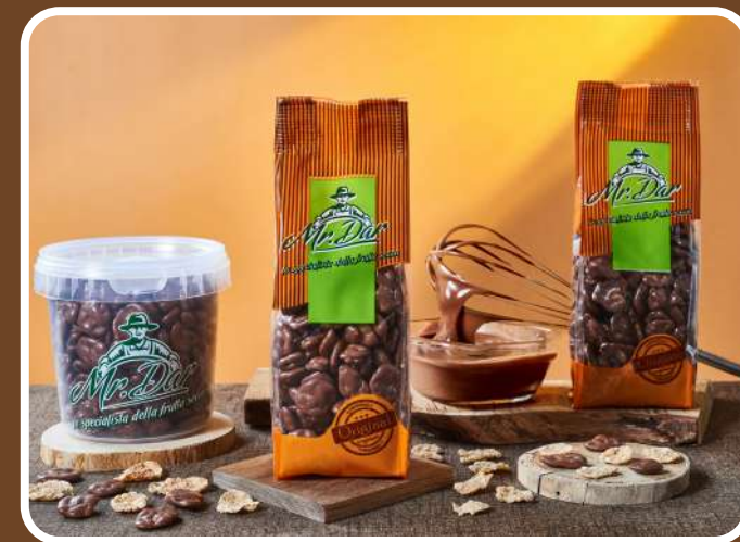
CIOCCOLATO AL LATTE