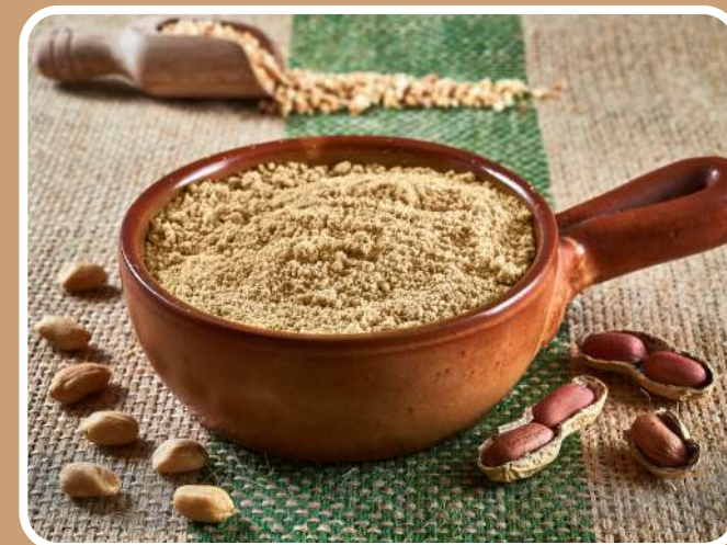
FARINA DI ARACHIDI