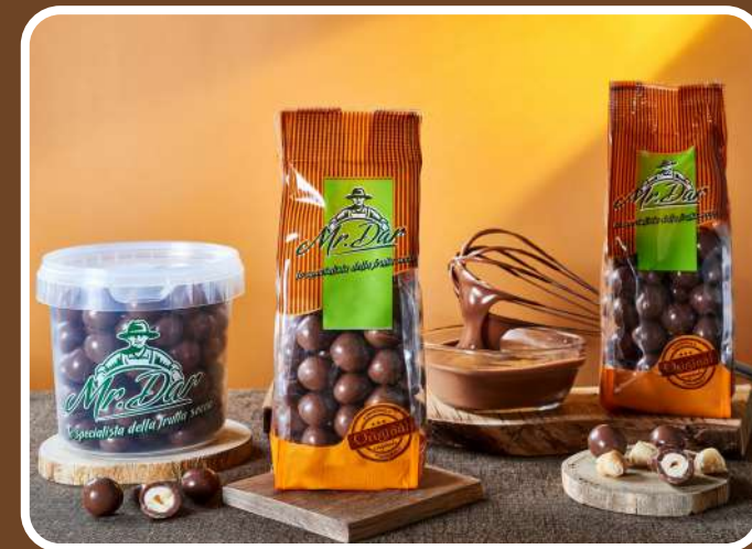
CIOCCOLATO AL LATTE