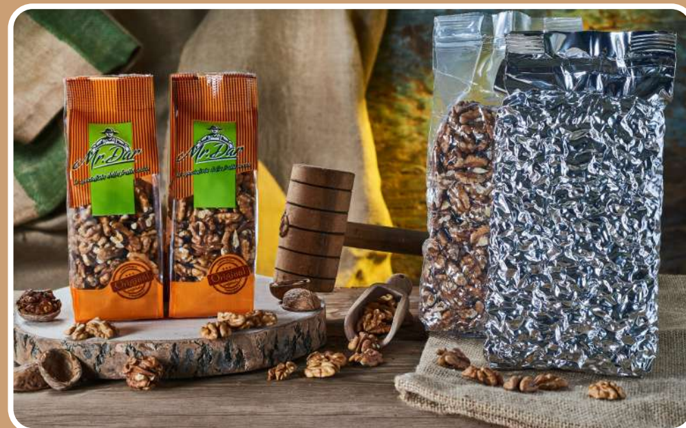
SGUSCIATE TIPO "A"