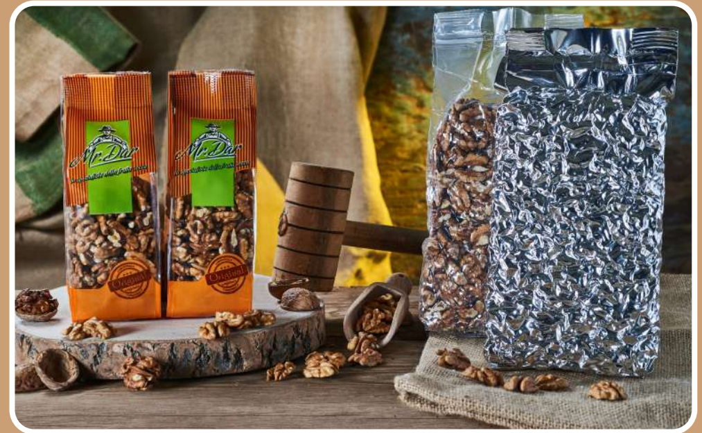
SGUSCIATE TIPO “B”

La noce è tradizionalmente considerata “simbolo di fortuna“: i Romani, in occasione di matrimoni, non lanciavano sugli sposi né confetti, né riso, bensì le noci! Questa antica usanza, era rimasta viva in Sicilia, fino agli inizi del ‘900.