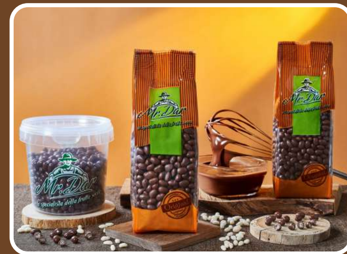
CIOCCOLATO AL LATTE