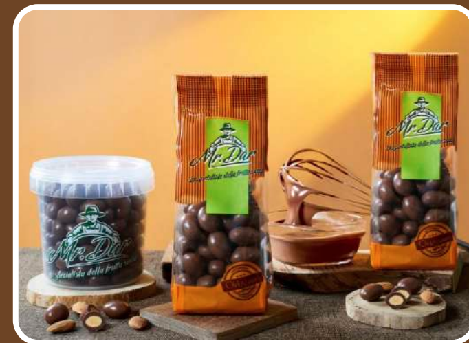
CIOCCOLATO AL LATTE