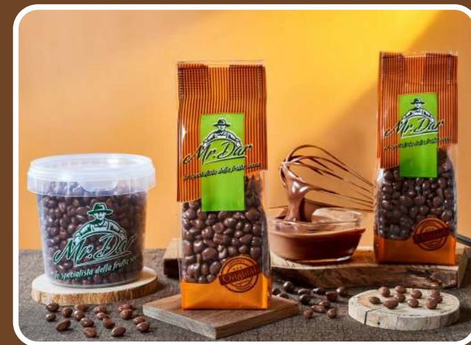
CIOCCOLATO AL LATTE