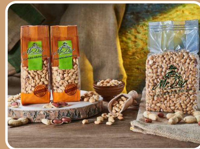
SGUSCIATE TOSTATE E SALATE