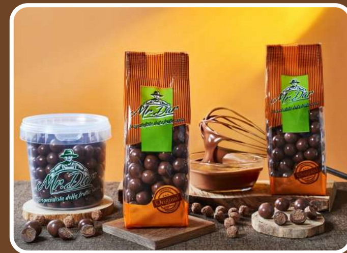
CIOCCOLATO AL LATTE