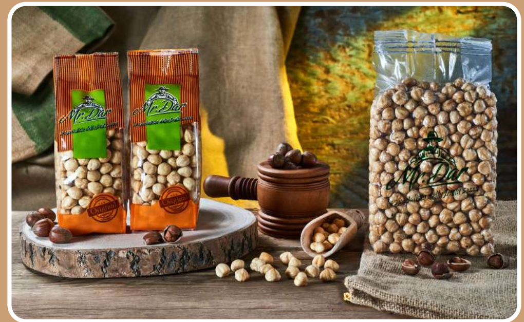
SGUSCIATE E TOSTATE

Si dice che sia proprio un ramo di nocciolo quello intorno a cui è attorcigliato il serpente del Bastone di Asclepio, Dio greco della medicina e oggi simbolo dell'ordine dei farmacisti.