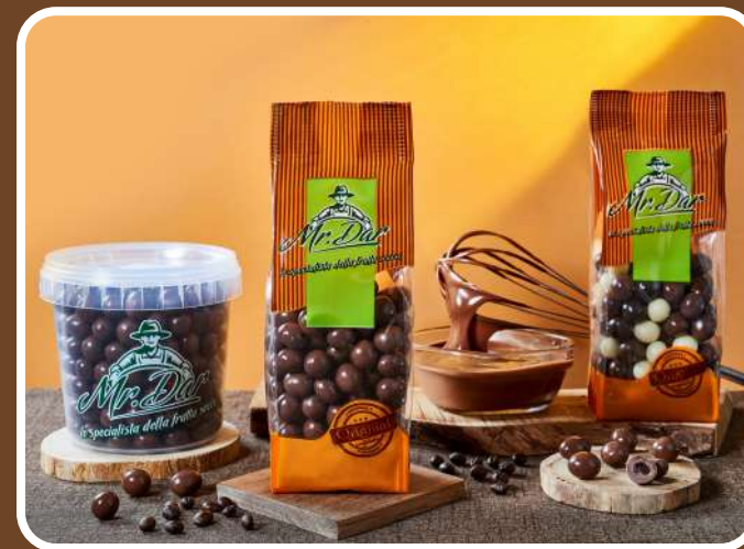
CIOCCOLATO AL LATTE