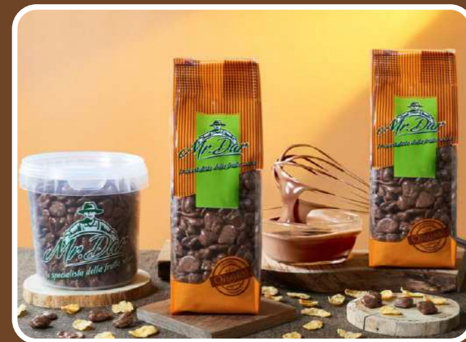
CIOCCOLATO AL LATTE