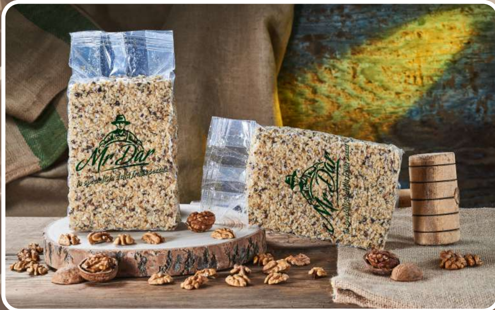
GRANELLA DI NOCI