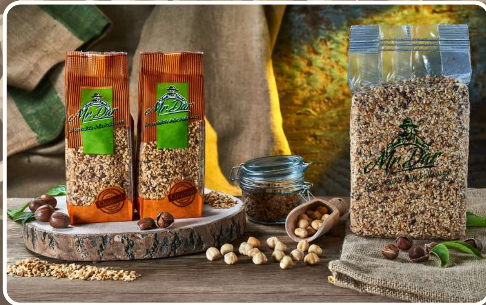
GRANELLA DI NOCCIOLE TOSTATE