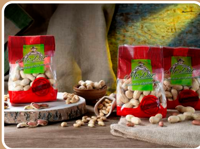
IN GUSCIO TOSTATE

Il primo burro d'arachidi pare sia stato inventato da un farmacista di Saint Louis di nome George A. Bayle jr. nel 1890 che, accortosi dell'elevata percentuale proteica di questi legumi, volle sviluppare per le famiglie meno abbienti un'alternativa alla carne, all'epoca molto costosa.