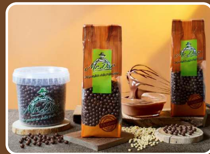
CIOCCOLATO AL LATTE