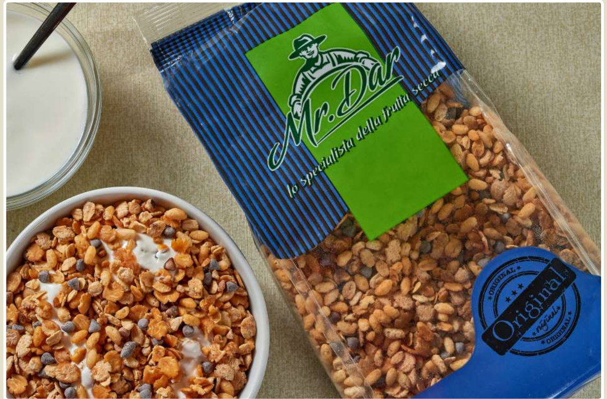
MUESLI CROCCANTE AL CIOCCOLATO

Muesli croccante e goloso, ottimo a colazione per una sferzata di energia per iniziare bene la giornata.