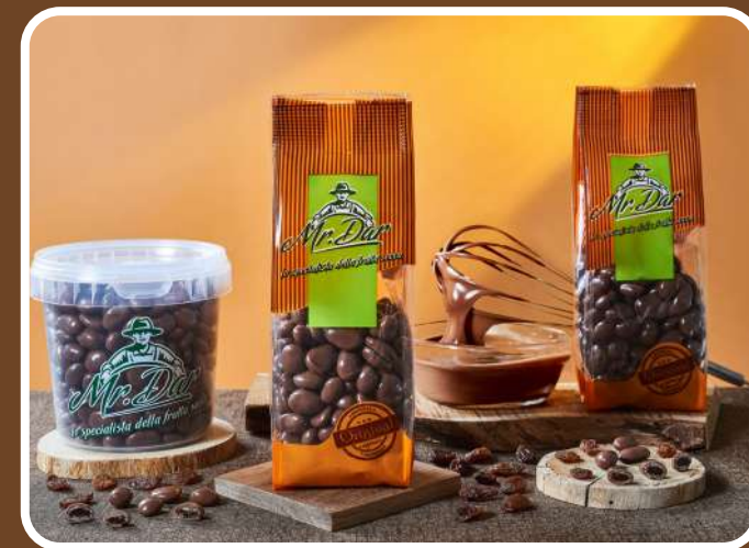
CIOCCOLATO AL LATTE