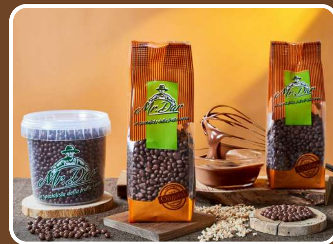
CIOCCOLATO AL LATTE