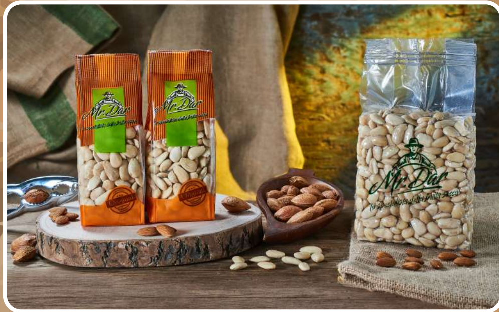
SGUSCIATE E PELATE