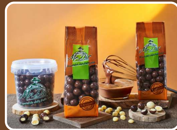
CIOCCOLATO AL LATTE