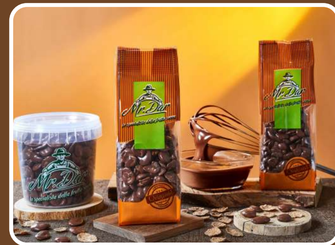
CIOCCOLATO AL LATTE