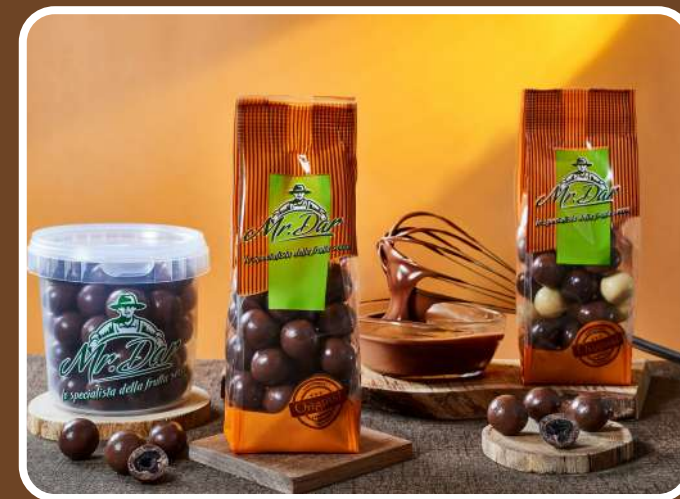
CIOCCOLATO AL LATTE