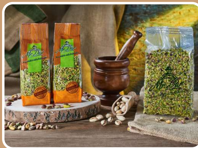
GRANELLA DI PISTACCHI