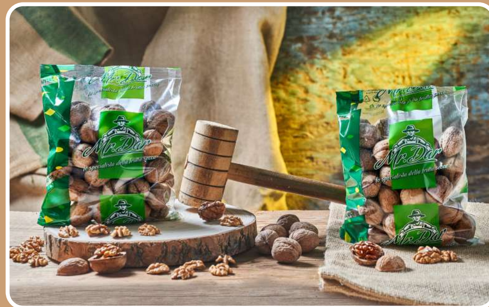
IN GUSCIO NATURALI