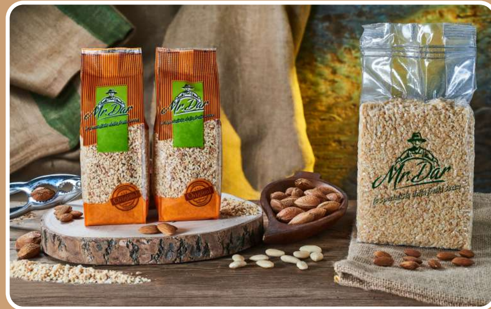
GRANELLA DI MANDORLE TOSTATE