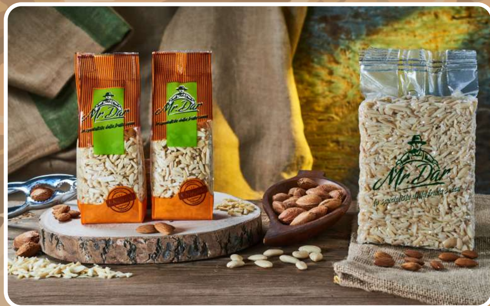
BASTONCINI DI MANDORLE PELATE