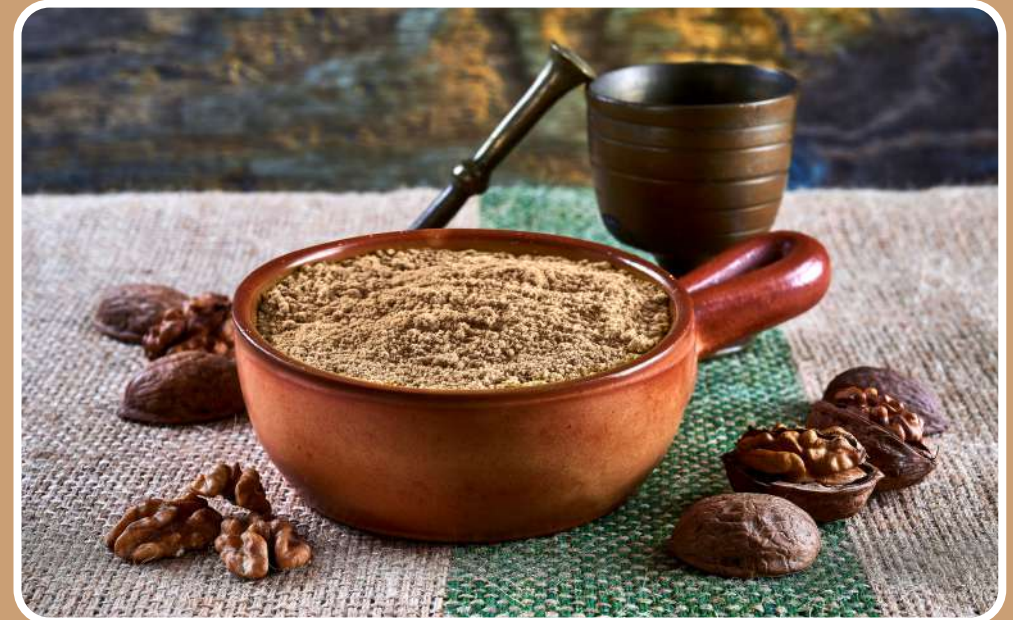
FARINA DI NOCI